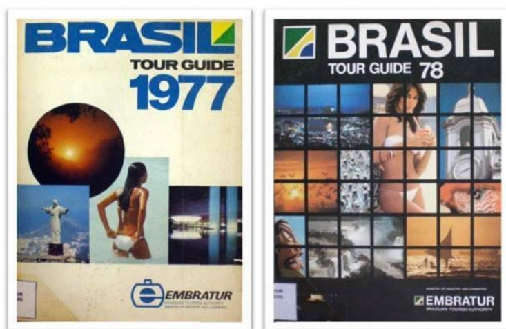
Ilustração 1- Propagandas do Turismo no Brasil divulgadas pela Embratur:

Algumas peças publicitárias (Ilustração 1) divulgadas no exterior vendiam a imagem do Brasil tendo como aporte a mulher brasileira como um produto turístico. Especialmente nos anos 1970/80 as imagens de mulheres de biquíni, sem um contexto ou grandes explicações expressa a valorização dos corpos femininos, particularmente o ‘bumbum’