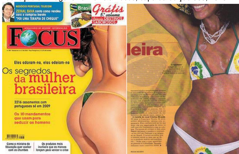
Ilustração 3- Imagens na Revista Focus, capa da edição 565, 2010